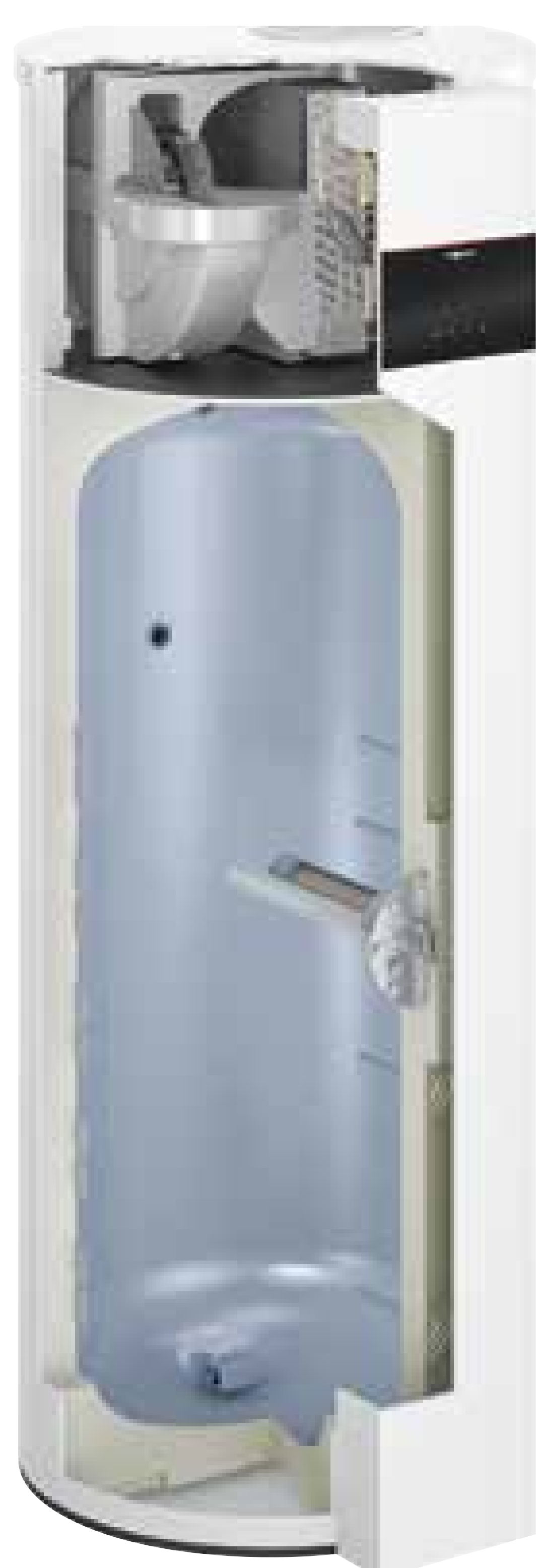
Elektrovariante Typ T2E-R290 mit Elektro-Heizeinsatz für Elektrospeicher-Austausch oder Parallelbetrieb mit Heizungswärmepumpe