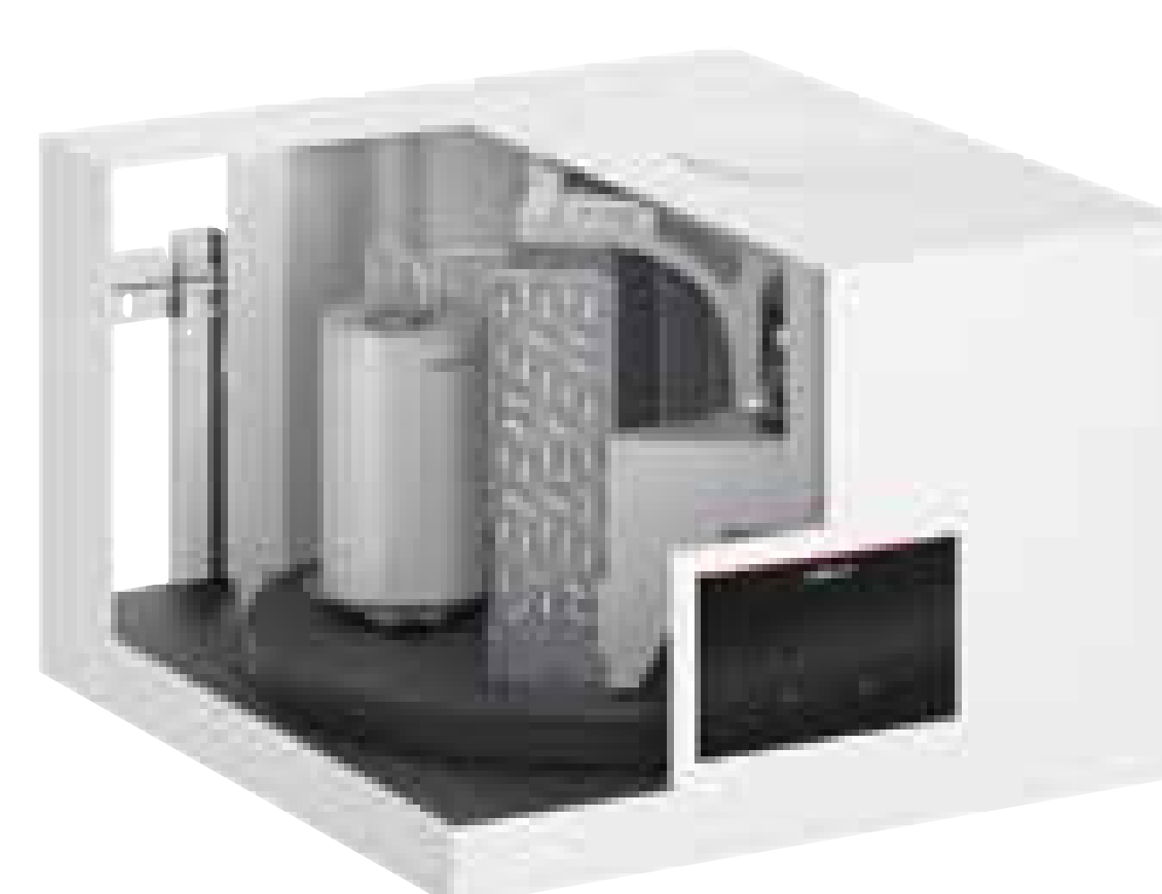
Wandhängende Variante Typ T2W-R290 kombinierbar mit einer Vielzahl von Speicher-Wassererwärmern