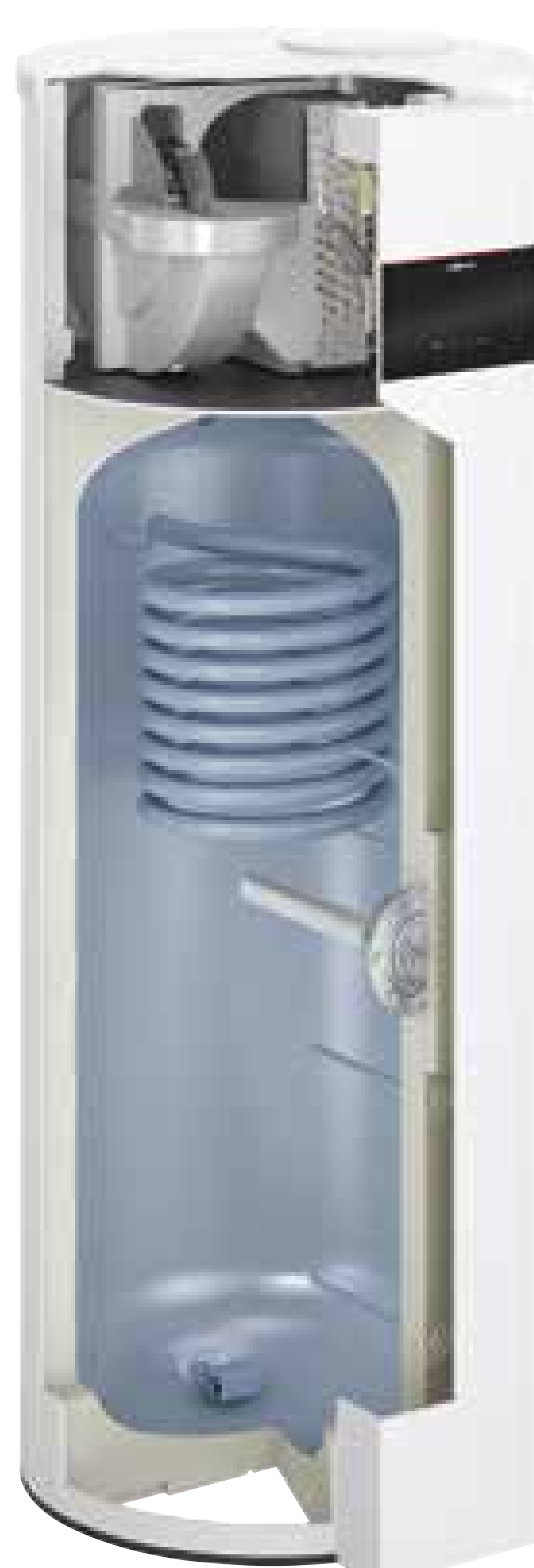
Hybridvariante Typ T2H-R290 mit Wärmetauscher für den Einsatz in Öl-, Gas-, Biomasse- und Fernwärme-Heizungen